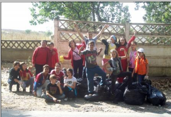
Foto 1. - „Let's do it România!” (Acțiune de ecologizare a pârului Bididia)